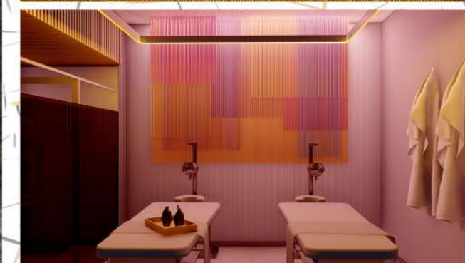
Zona de hidroterapia